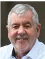
Uli Gerhardt Governor 2023/24 Distrikt 1841